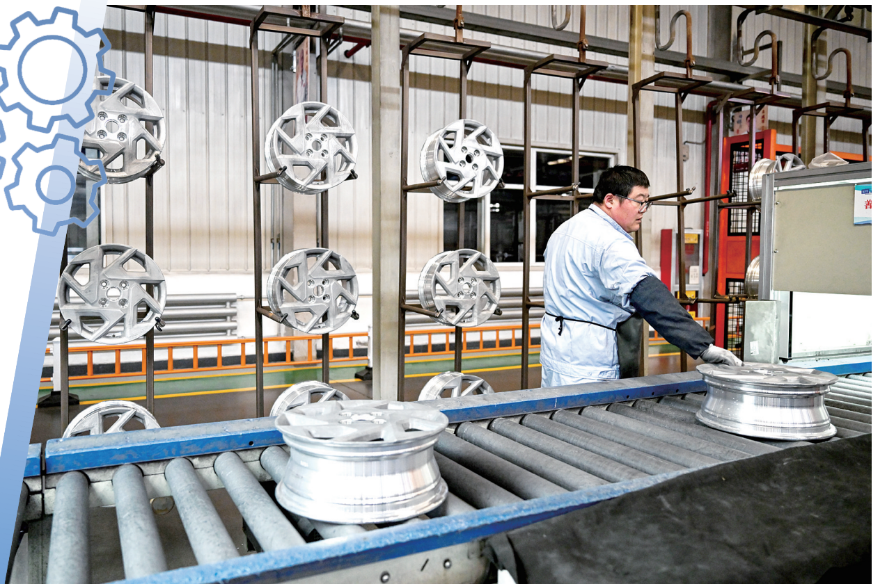
工人在包头盛泰汽车零部件制造有限公司铝合金轮毂生产线上作业。