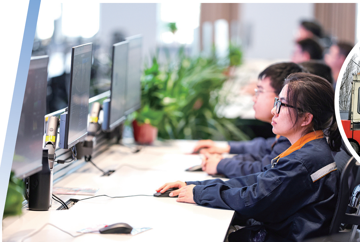
工人在包头铝业有限公司集控室监控生产情况。