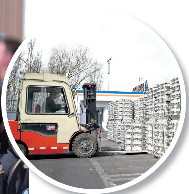
工人在包头铝业有限公司驾驶叉车搬运铝锭。