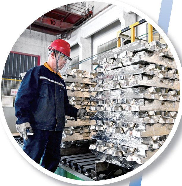
工人在包头铝业有限公司铸铝生产线上作业。