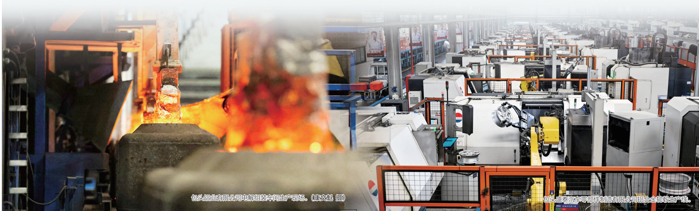
包头铝业有限公司电解组装车间生产现场。