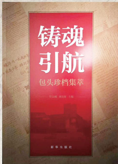
《铸魂·引航——包头珍档集萃》

历史是最好的教科书，档案是最真的记录者。三本新书，让包头的来路更清晰、精神更鲜明、底气更充足。期待更多档案资源活化利用，让城市记忆代代相传，让文化根脉生生不息。