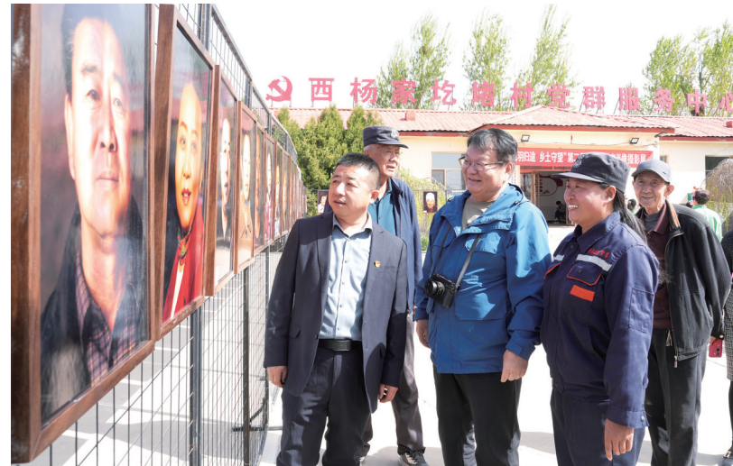
摄影展吸引了众多摄影爱好者和村民观展。